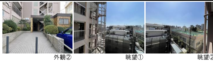
外観② 眺望① 眺望②