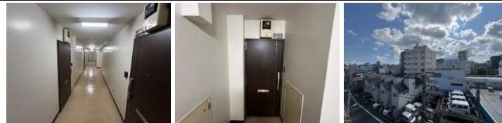
内廊下 玄関ドア(改修済) 眺望

※図面の間取・方位・仕様は現況優先となります。※司法書士は売主指定の司法書士となります。