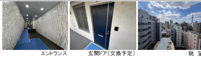
エントランス 玄関ドア(交換予定) 眺望

※図面の間取・方位・仕様は現況優先となります。※司法書士は売主指定の司法書士となります。