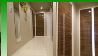
鏡面建具・人造大理石フロア