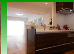
システムキッチン