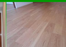
天然木フローリング