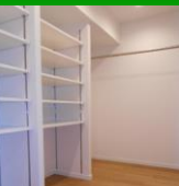
ウォークインクローゼット