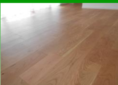
天然木フローリング