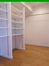
ウォークインクローゼット