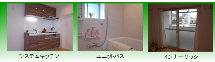
システムキッチン