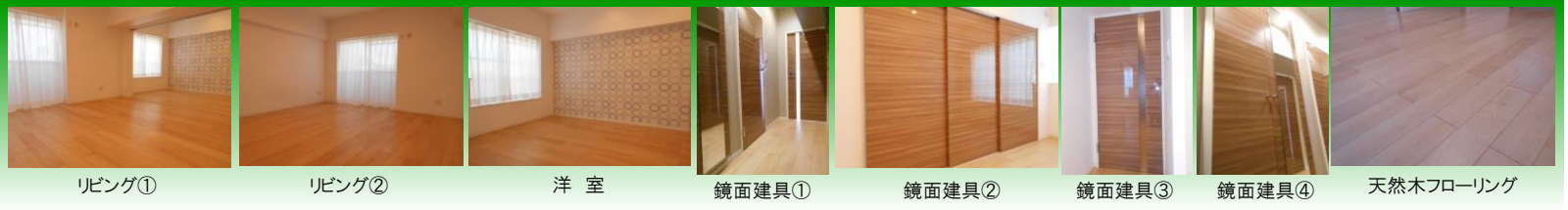
リビング① リビング② 洋室 鏡面建具① 鏡面建具② 鏡面建具③ 鏡面建具④ 天然木フローリング