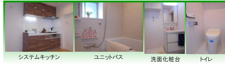
システムキッチン ユニットバス 洗面化粧台 トイレ