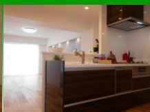
カウンターキッチン