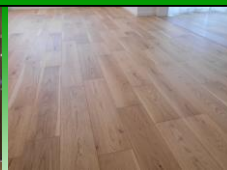
天然木フローリング