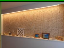
ニッチカウンター