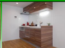
システムキッチン